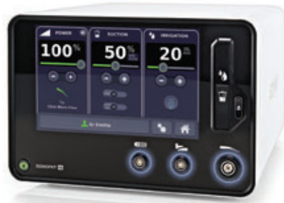
SONOPET iQ 25kHz アングルハンドピース 5500-255-000 *1